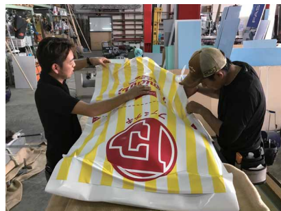
FRP製の某オリジナルキャラクターにもラッピング。