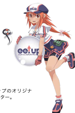
イールアップのオリジナルキャラクター。

千葉県船橋市高瀬町62-2-B3 TEL.047-437-3881 FAX.047-437-3882 http://www.eelup.co.jp