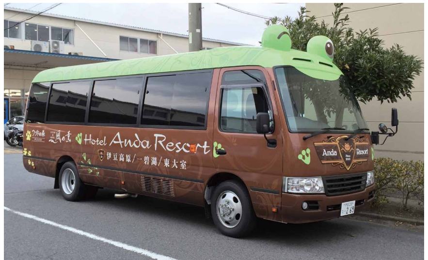
FRPで作成した後にラッピングした送迎バス。