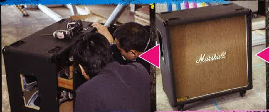
④工場の方が丁寧にアンプの中を取り除き、機械を設置。