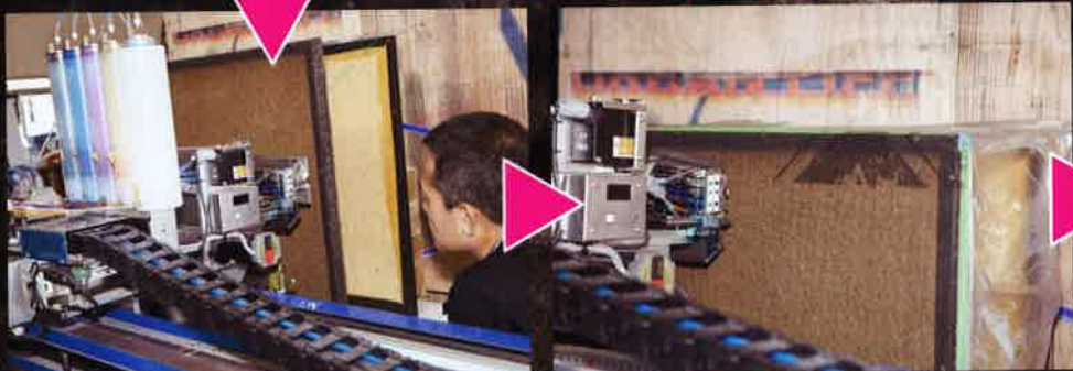
⑤プリント。完成は約2時間。1ミリのズレもない、正確なペイント!!