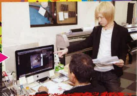
②デザイナーさんと一緒にマークの入る位置を確認しながら決めていきます。