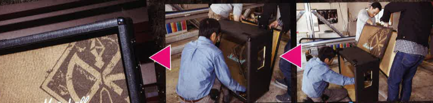
⑥ペイントが済んだら、アンプを元の通りに設置。